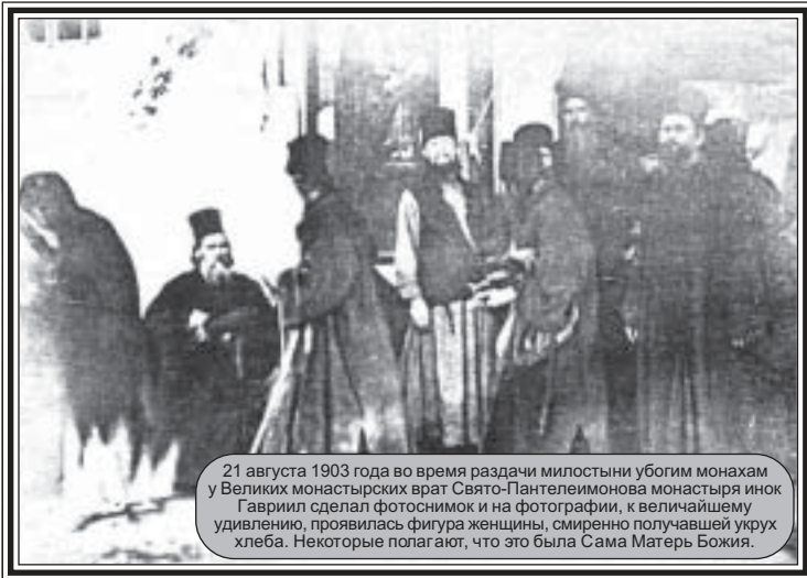
21 августа 1903 года во время раздачи милостыни убогим монахам у Великих монастырских врат Свято-Пантелеимонова монастыря инок Гавриил сделал фотоснимок и на фотографии, к величайшему удивлению, проявилась фигура женщины, смиренно получавшей укрох хлеба. Некоторые полагают, что это была Сама Матерь Божия.