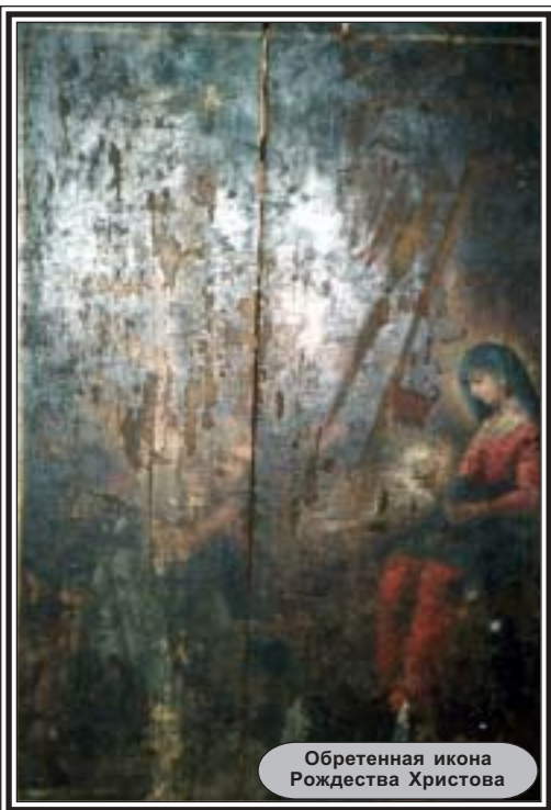
Обретенная икона Рождества Христова