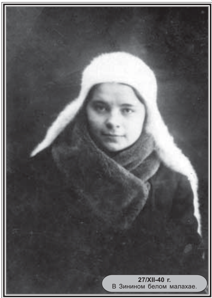
27/ХІІ-40 г. В Зинином белом малахае.

Сегодня девчата накупили туфель и чулок, я все меряла, и очень захотелось туфель на высоком, брезенто-