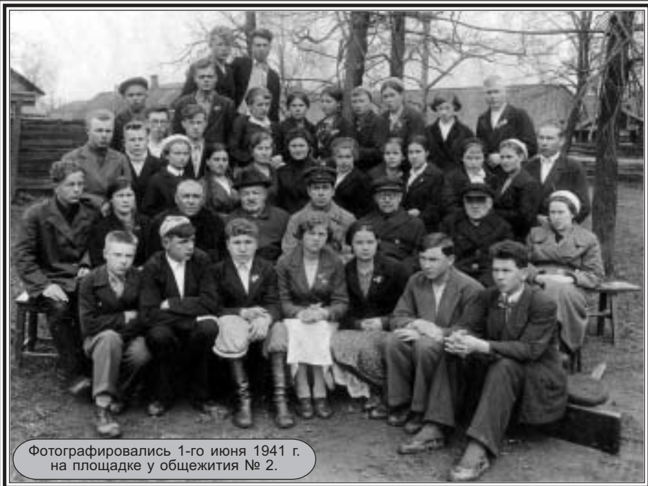
Фотографировались 1-го июня 1941 г. на площадке у общежития № 2.