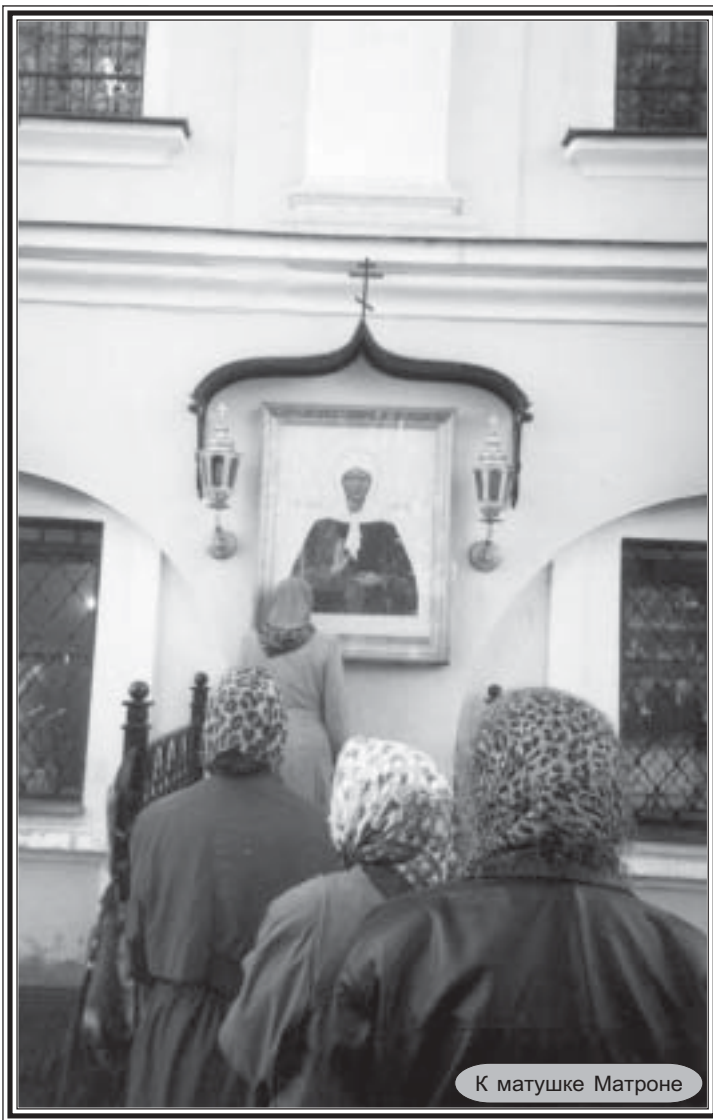
К матушке Матроне